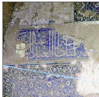
تصویر ۴، بخشی از کتیبه سردر قبه سبز، خط ثلث

در خصوص این‌که این بنا در وضعیت فعلی متعلق به سده هفتم ق نیست، شرودر بر اساس سبک معماری معتقد است «سبک بنا ما را از این‌که آن را به مدرسه ترکان خاتون وابسته بدانیم منع می‌کند، بنایی که گویا در همان محله بوده است (شرودر، ۱۳۸۷: ۱۴۷۲). از مهم‌ترین بخش‌های بنای باقیمانده کاشی کاری بنا است. «کاشی معرق روی دیوار سمت چپ شامل یک اسپر بزرگ از گل‌ها و نقش درخت انگور تزئینی وابسته به سده پانزدهم م (سده نهم ق) اصفهان در درب امام است (ویلبر و گلمیک، ۱۳۷۶: ۵۶۰).