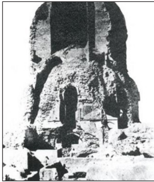
تصویر ۲، قبه سبز، اواخر دوره قاجار، پیش از زلزله و تخریب بقایای گنبد دوبوش.

نیز تاریخ ساخت بنا را ۸۴۰ ق دانسته است (اسلام‌پناه، ۱۳۴۷: ۴۰۰)