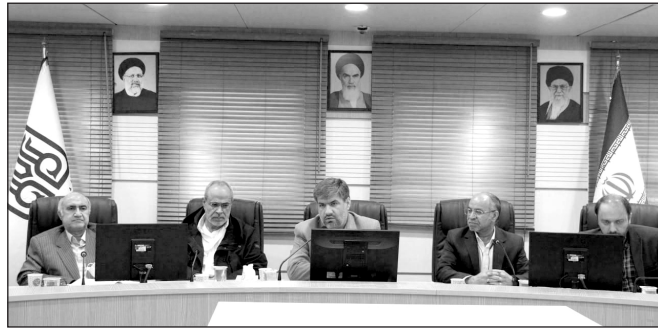
ما در تراز اسلامی و دانشگاه تمدن‌ساز نیست.