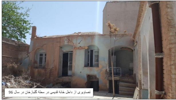
تصاویری از داخل خانه قدیمی در محله گلباز خان در سال ۹۶