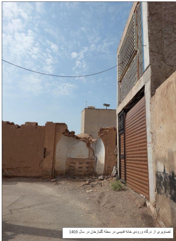
تصاویری از درگاه ورودی خانه قدیمی در محله گلباز خان در سال ۱۴۰۳