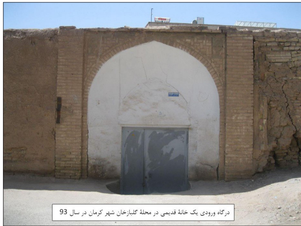
درگاه ورودی یک خانه قدیمی در محله گلباز خان شهر کرمان در سال ۹۳

وی با اشاره به تخریب بنای قدیمی در محله گلباز خان اظهار کرد: «شاید این بنا از نظر معماری چندان فاخر و ارزشمند نباشد اما همین که در مدت زمانی نسبتاً کوتاه تخریب شد نشان می‌دهد بافت تاریخی شهر کرمان چقدر مورد بی‌مهری قرار گرفته است».