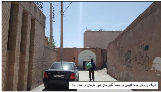
درگاه ورودی خانه قدیمی در محله گلباز خان شهر کرمان در سال ۹۶